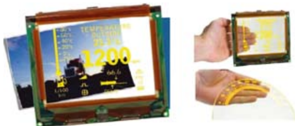
Рис. 4. Примеры прозрачных электролюминесцентных дисплеев фирмы Planar

некоторых критичных данных непосредственно на лобовом стекле вертолета, что обеспечивается надежностью работы дисплея при очень низких температурах и пониженном давлении. На рисунке 4 изображены примеры прозрачных электролюминес-