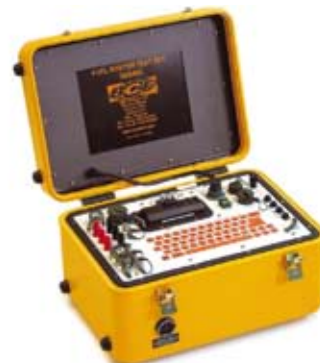
Комплект управления заправкой авиационным топливом