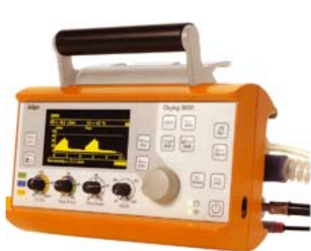
Аппарат вентиляции легких

Фирма Planar изготавливает с помощью технологии TFEL дисплеев прозрачные электролюминесцентные дисплеи, выпущенные в форме, удобной для заказчика. Такие дисплеи могут быть с успехом использованы, к примеру, для отображения