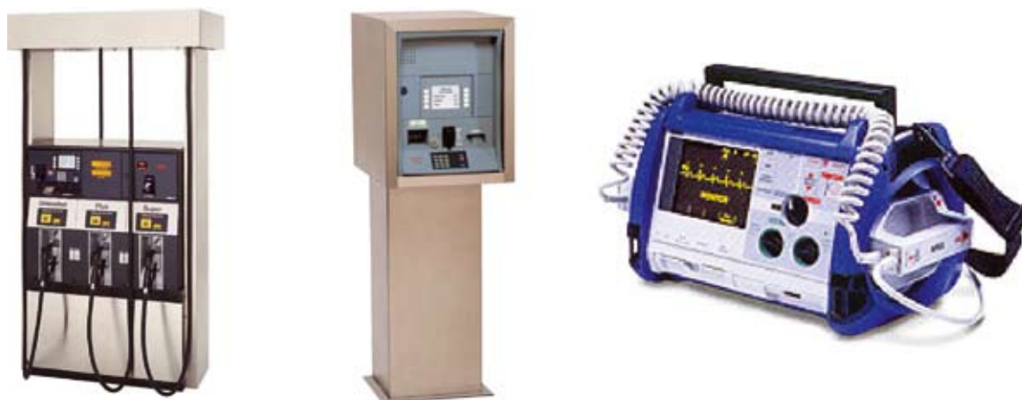
Рис. 1. Примеры аппаратуры для тяжелых условий эксплуатации

Как видно из приведенных выше таблиц номенклатура полноцветных TFT и OLED дисплеев позволяет реализовать устройства, устойчивые к температуре до -30^{\circ}\text{C} с дисплеями как малых (1,5"), так и достаточно крупных (12,1") форматов. Такие дисплеи могут быть с успехом использованы в мобильной аппаратуре позиционирования систем GPS или ГЛОНАСС,