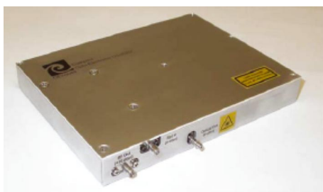
Рис. 1. Компактный оптоэлектронный генератор

В статье рассказывается об оптоэлектронных генераторах нового поколения американской компании OEwaves, которые позволяют генерировать колебания СВЧ-диапазона с беспрецедентно низкими уровнями фазовых шумов.