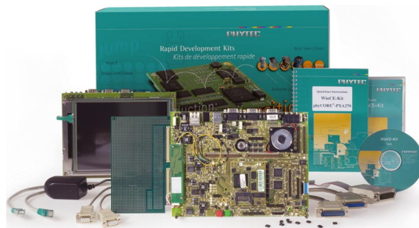
рис. 2. Rapid Development Kit phyCORE-XScale/PXA270

Spectrum CD содержит демо-версии инструментальных средств разработки и User's Manuals — документацию по модулю, плате разработки и микроконтроллеру. В руководстве по быстрому запуску QuickStart Manual описывается, как подключить модуль, загрузить и выполнить демонстрационные программы. Development Board предназначена для запуска и программирования модуля, тестирования программного обеспечения и содержит все необходимые электрические и механические компоненты. В состав Rapid Development Kit (см. рис. 2) дополнительно входит макетная плата Bare PCB. Для подключения к Bare PCB на Development Board предусмотрена шина Expansion Bus, которая выводит сигналы модуля на 2 разъема по 160 контактов, расположенные на краю платы.